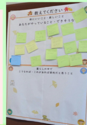
認知症コーナーでは皆様より実施している事出来そうな事あればよいなど、思う事など記入していただきました