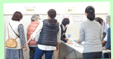
体力測定コーナー 握力・片足立ち ファンクショナルリーチ