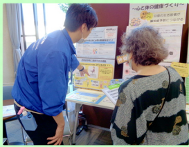
清智会記念病院職員による出張「リハカフェ」コーナー 運動や栄養について展示

「心と体の健康づくり」をテーマに、元気な時から取り組める食事や運動、生活習慣について、その延長上にある認知症、地域での活動について各コーナーを設置しました。クイズの出題もあり、体力測定会には2日間延べ164名の方に参加を頂きました。ありがとうございました。