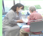
カフェコーナーでひと息